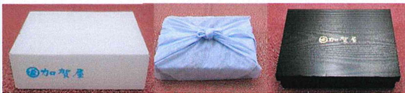
【専用外箱】 【風呂敷に包んでお届け】 【高級感のある専用容器】